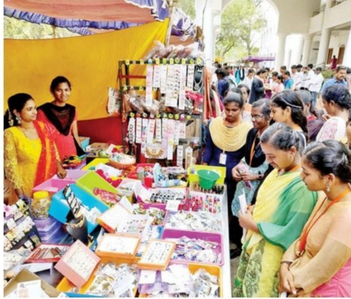
மன்னர் திருமலை நாயக்கர் கல்லூரியில் நடைபெற்ற வர்த்தகக் கண்காட்சியைப் பார்வையிட்ட மாணவிகள்.

கல்லூரி வணிகவியல் துறை மாணவர்கள், முன் னாள் மாணவர்கள் சார்பில் வீட்டு உபயோகப் பொருள் கள், ஆட்டோ மொபைல், இயற்கைவேளாண்பொருள் கள், புத்தகங்கள், ஜவுளிகள், விளையாட்டு சாதனங்கள், கைவினைப் பொருள்கள், அழகு சாதனப் பொருள்கள்,